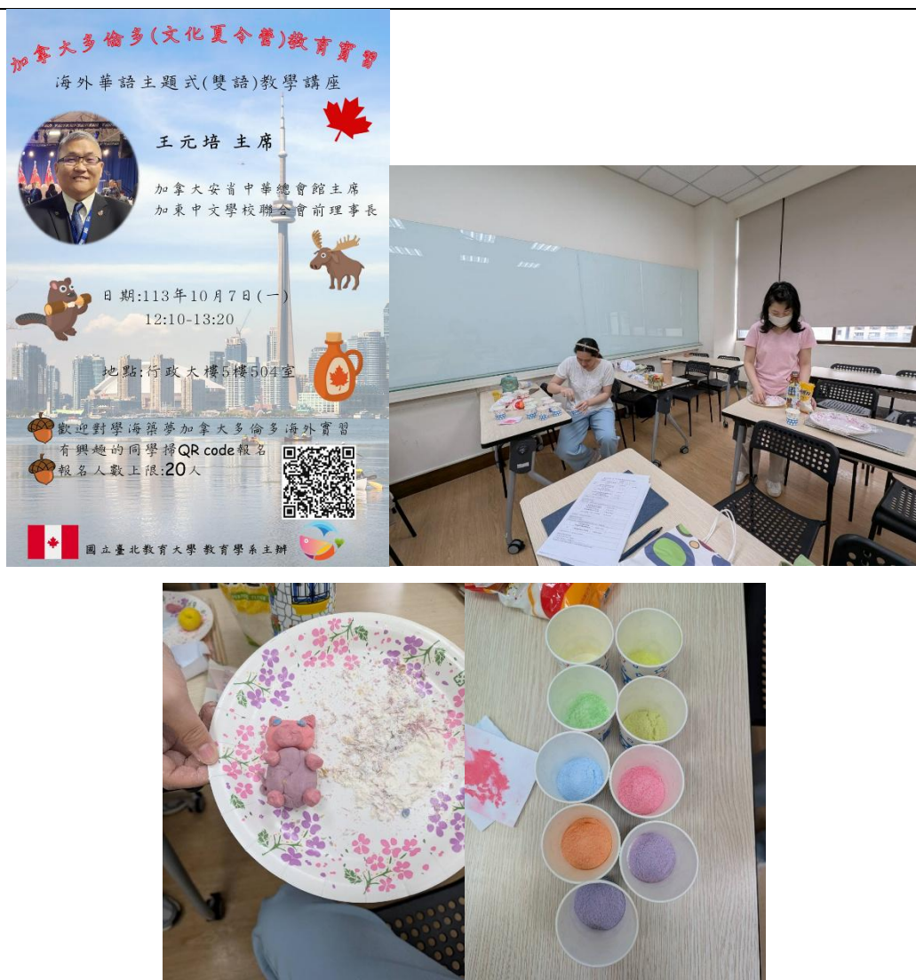
圖三: 講座海報及行前教學準備