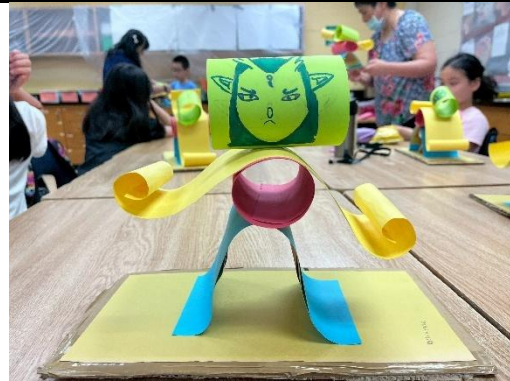
中高年級課程作品