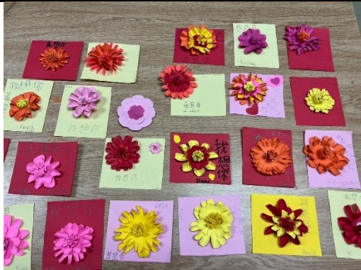
中低年級課程作品