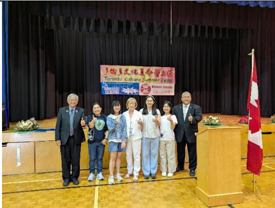
與多倫多議員、教育局官員及王主席合照