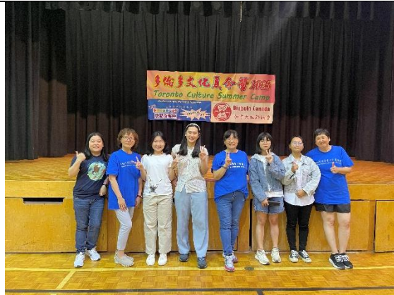
全體師長及實習生合照