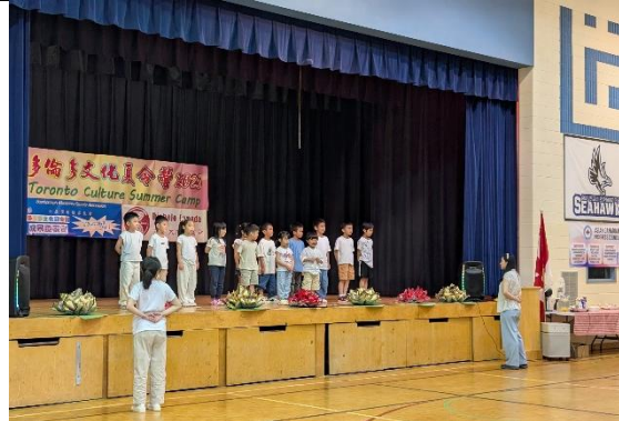
兩位實習生帶學生練習成果發表的表演