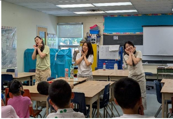
兩位實習生帶學生練習成果發表的表演